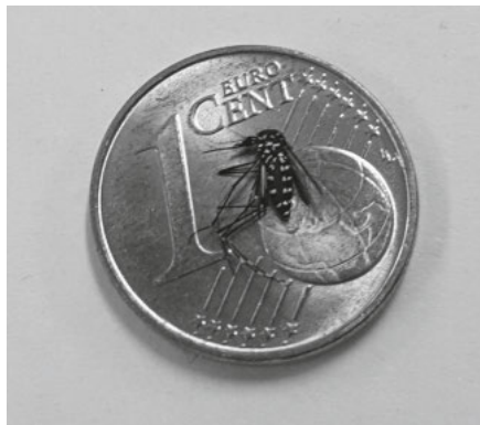
Asiatische Tigermücke auf 1-Cent-Münze

Als vergleichsweise kleine Stechmückenart passt die Asiatische Tigermücke auf den Globus einer 1-Cent-Münze.