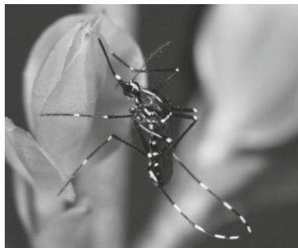
Asiatische Tigermücke

Tigermücken können anhand von drei Merkmalen eindeutig von anderen Stechmücken