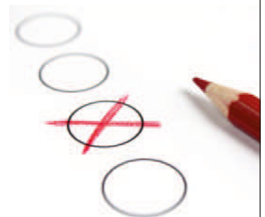
Nikolas Kopp Bürgermeister