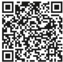
QR-Code Meldeplattform Asiatische Hornisse

Sichtungen von Einzeltieren und insbesondere Nester sollen weiterhin ausschließlich über die Meldeplattform der Landesanstalt für Umwelt gemeldet werden. Dies kann über die Homepage der Landesanstalt für Umwelt (LUBW) oder über die kostenlose „Meine Umwelt-App“ erfolgen: